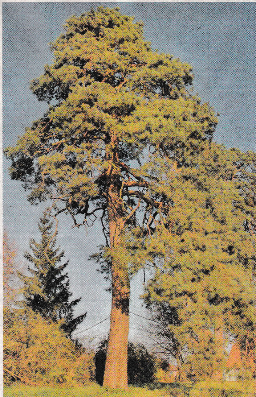
A park bejárata közelében ma is látható a két tekintélyes méretű erdei fenyő. Egyiknek a törzse mellmagasságban 288 cm, a másiké 267 cm. Magasságuk eléri a 28 métert.