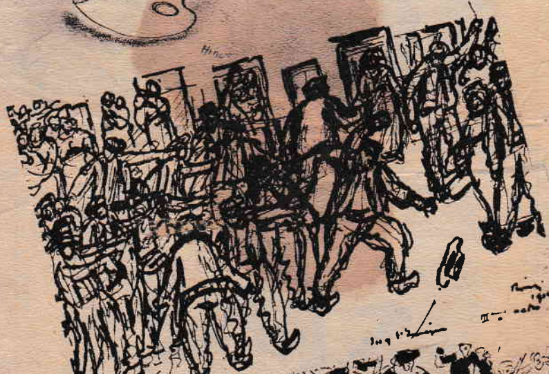
»Igy vertek Párizsban...«