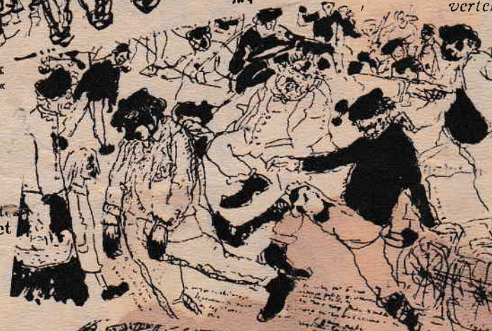
»Nem kimélt, egy cseppet se...«