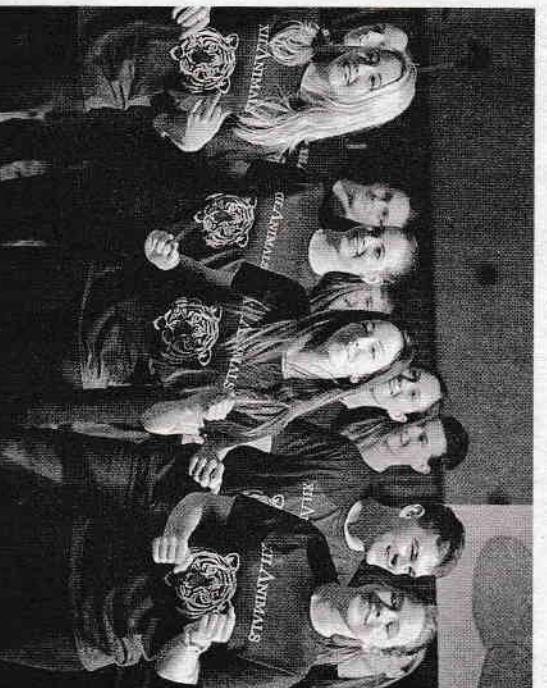
SODRÓ JENDRIK, TÁNC: JÉ KZMELELTTE A LAIVNYOS PÉNTÉKI PROGRÁMOT

nelem-latin szakos tanárnőnek ítélték oda, aki 1989. óta tanít a tantintézményben. Az indoklás szerint a szakember tanítványai számos tanulmányi versenyen szép eredményeket értek el, s a csapatversenyekben való fekszsítésben is jeleskedett. Több száz gyermek nevelésében vállalt meghatározó szerepet. Hivatásáról vallja: alapja a kölcsönös tisztélet. Tanítani csak szívvel-lelkekkel lehet és érdeemes, példamutatással, úgy, hogy a tanár maga is állandóan tanul, és nemcsak szakirodalmat, hanem a tinédzserké nyolult és csodálatos gondolatvilágát és lelki reziliánsait is.