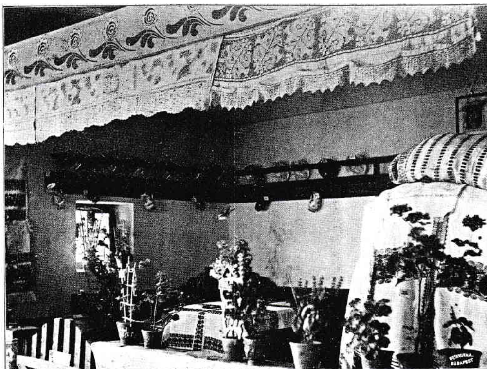
SOMOGYI PARASZTSZOBA. A KAPOSVÁRI IPARMŰVÉSZETI KIÁLLÍTÁSON.