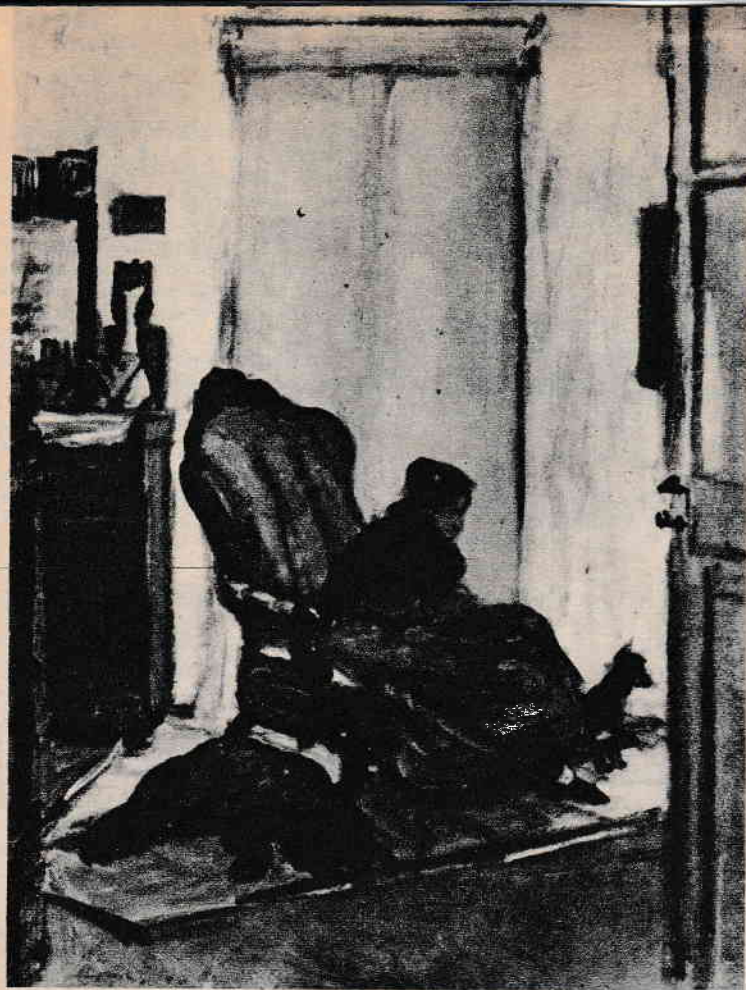
»Flox és Flox«