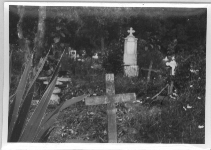
3. számú kép