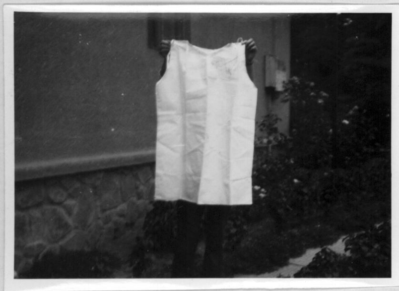
I. számú kép