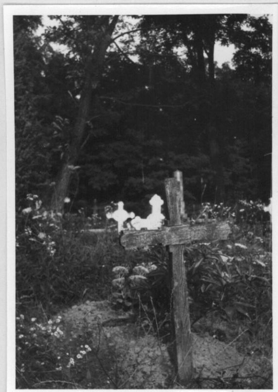
2. számú kép