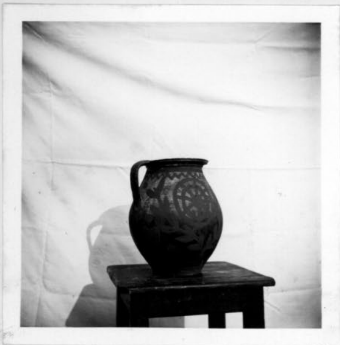
Bablevest, gulyást és káposztát tároltak benne. Tűzön melegítették. Alapszíne zöld, díszítése piros. Kb. 4-5 literes.