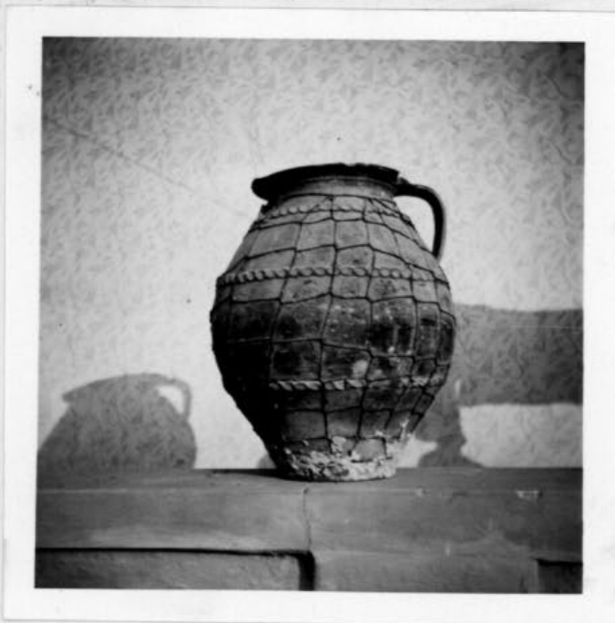
A lakodalom híres étele, a káposzta tárolására szolgált ez a cserépedény. Nem tették a tűzre, hanem mellette melegedett. Ha az egyik fele megmelegedett, akkor fordítottak rajta, a hideg oldalára. Kb. 15 literes lehetett.