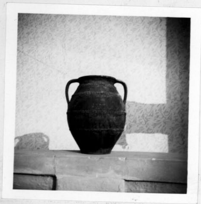
A gulyásfőzés legfontosabb edénye. Vas háromlábason melegítették fel benne levő ételt. Kívül anyagmintázásu, barna és zöld színű festése volt. Kb. nyolc-tíz literes.