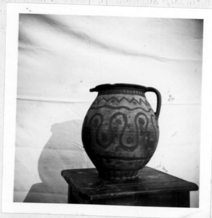
Husoskáposztát tároltak benne. A káposztalevet előtte kicsurgatták, úgy, hogy lekötötték az edényt és a szája szélén lévő bemélyedésen csurgott ki a lé. Alapszíne zöld, dászítése piros. Kb. 5 literes.