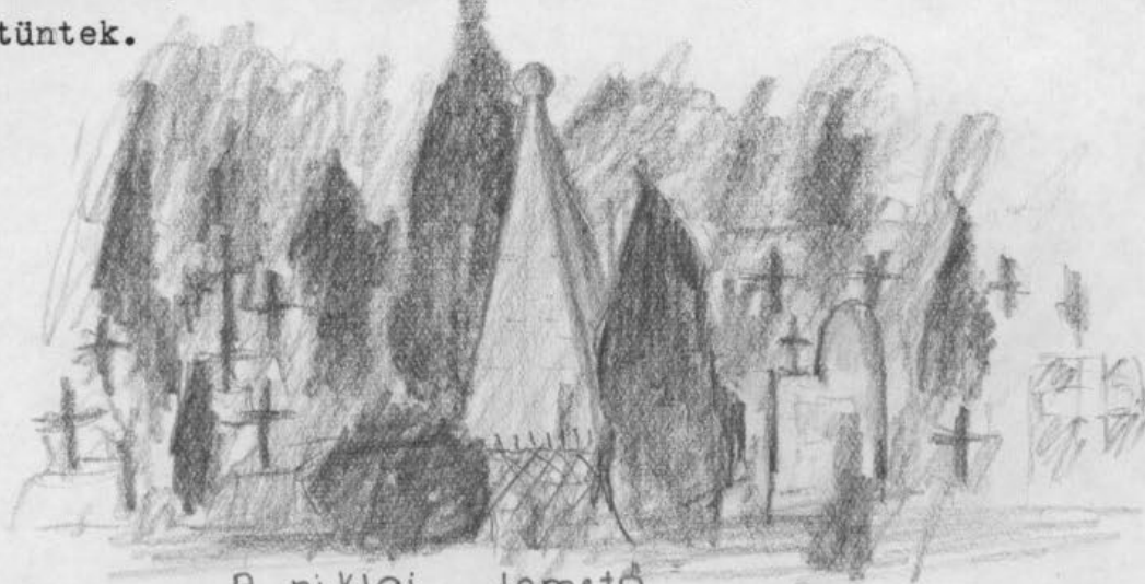
A niklai temető