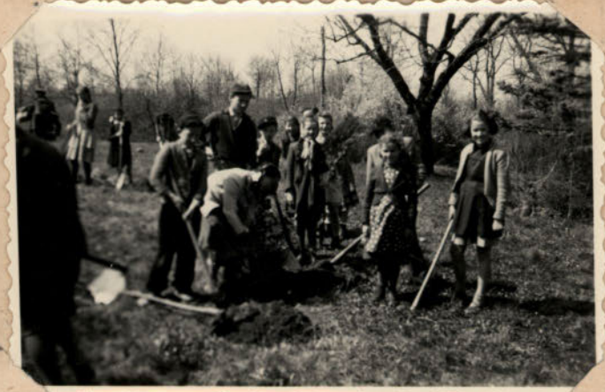
FÁSITANAK AZ UTTÖRŐK.