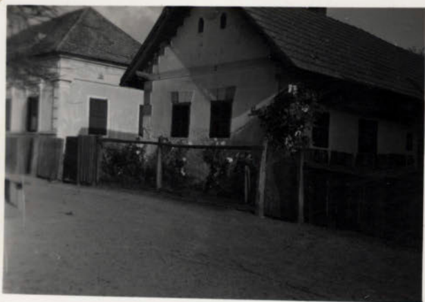
LEGREGIBB HÁZ. 1852. [A TÉPÜC.]