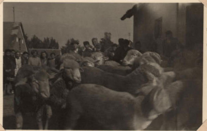
LÁBODI ÁLL. GAZD. JUH-ÉS BAROMFI TENYÉSZETE