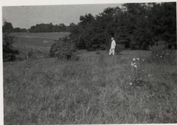
RÉGI KÖZSÉG HELYE.