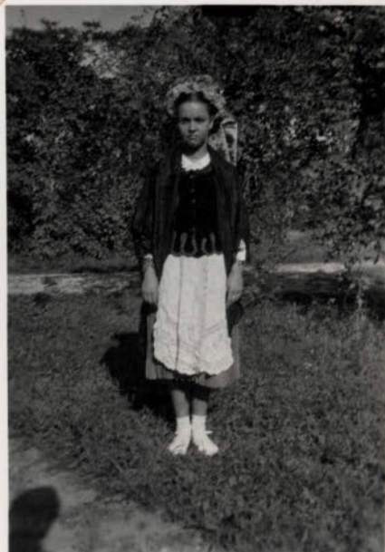
LÁBODI NÉPVISELET KONTYÓS FÖKÖTÖVEL. 1870 - 1910