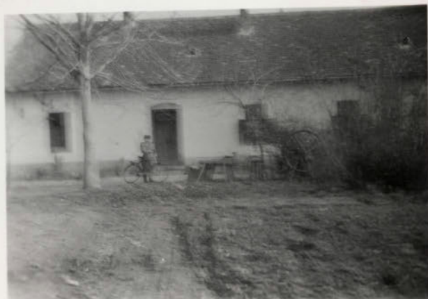
„BÉKE” TSZ. IRODA