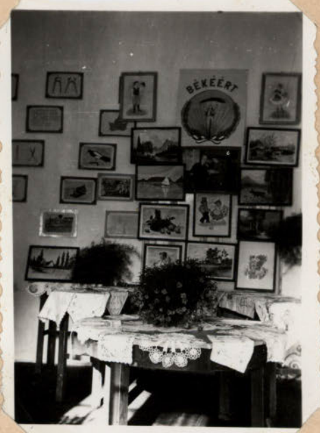
ANKAIRNOS ISKOLÁBAN RAJZ ÉS KÉZMUNKA KIÁLLÍTÁS.