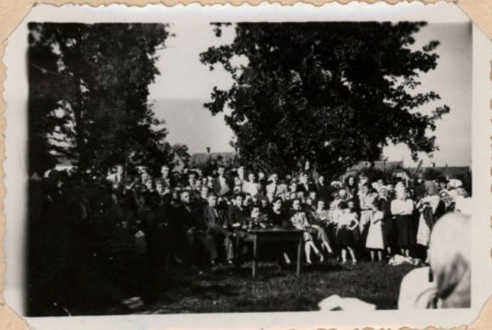
ELSŐ PEDAGÓGUS NAP