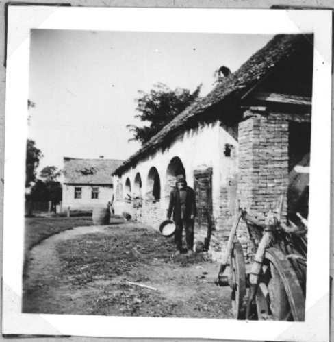
A legrégebbi téglaház Kálmánoson 1832-ből Nemesi eredetű családé.