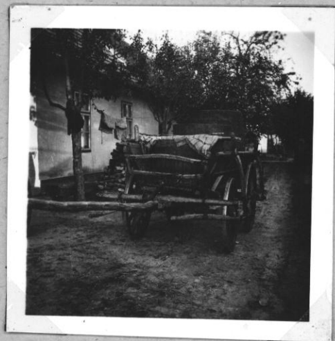
Pincebez induló szekes szüreteléshez