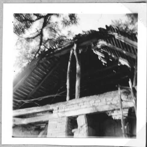
Gőnkafarú rosz Jelő rögátése allógással