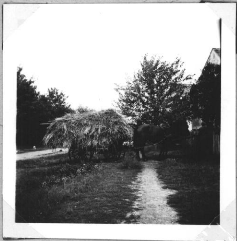
Szalmat lúdó szekes