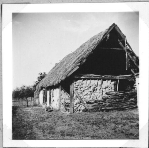
Karóval szilárdított sárfalu szin és istálló