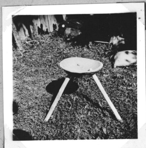
Konyhában, istállóban használták. "Fejőszék"