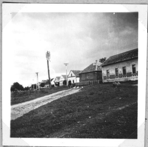
Kálmánosai utcakép a régi faluszcében elől a postaeépülettel.