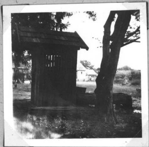
Kerekeskút lécborítással tású kávézattal