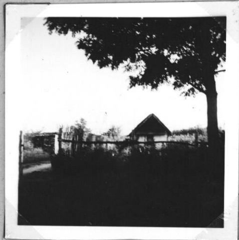
Cigányputri az új falusiaszhen