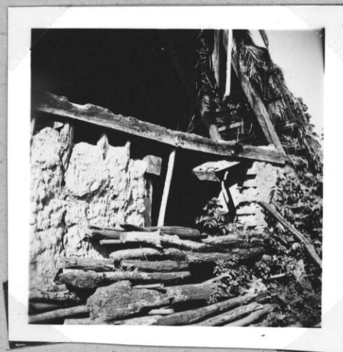
Karóval szilárdított sárfal szalufás rekezelő jelőzet