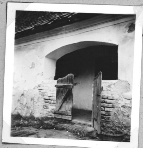
Házrészlet, pítar, az ebből gyűlö romjaira má- szokéményes