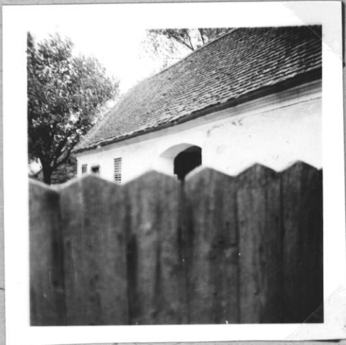
Pitaros ház. Középparaszt gazdál