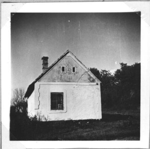
Két helyiséges ház átalakított ablakkal és tölgyzettel.