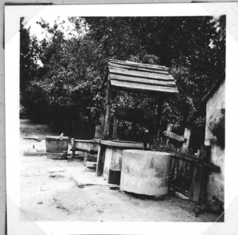
Kerekes kút, beton kávával