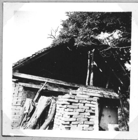
Szalufás Jelőreikezet rapott végűvel utólagos rögátése allógással