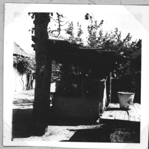
Udvari keményítő és főző kemence