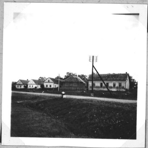
Kálmánosai utcakép a régi faluszcében, elől a postaeépülettel