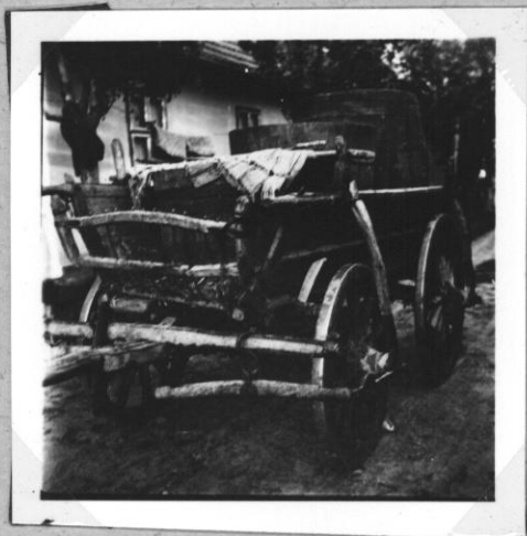
Pincebez induló szekes, szüreteléshez