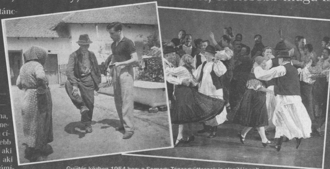
Gyűjtés közben 1954-ben; a Somogy Táncgyűjtésnek is alapítója volt

A főiskola után a megyei tanács népművelési osztályára került. Kezébe vette a somogyi táncmozgalom sorsát, 1957-től Balatonszemesen szervezett képzéseket, 1962-