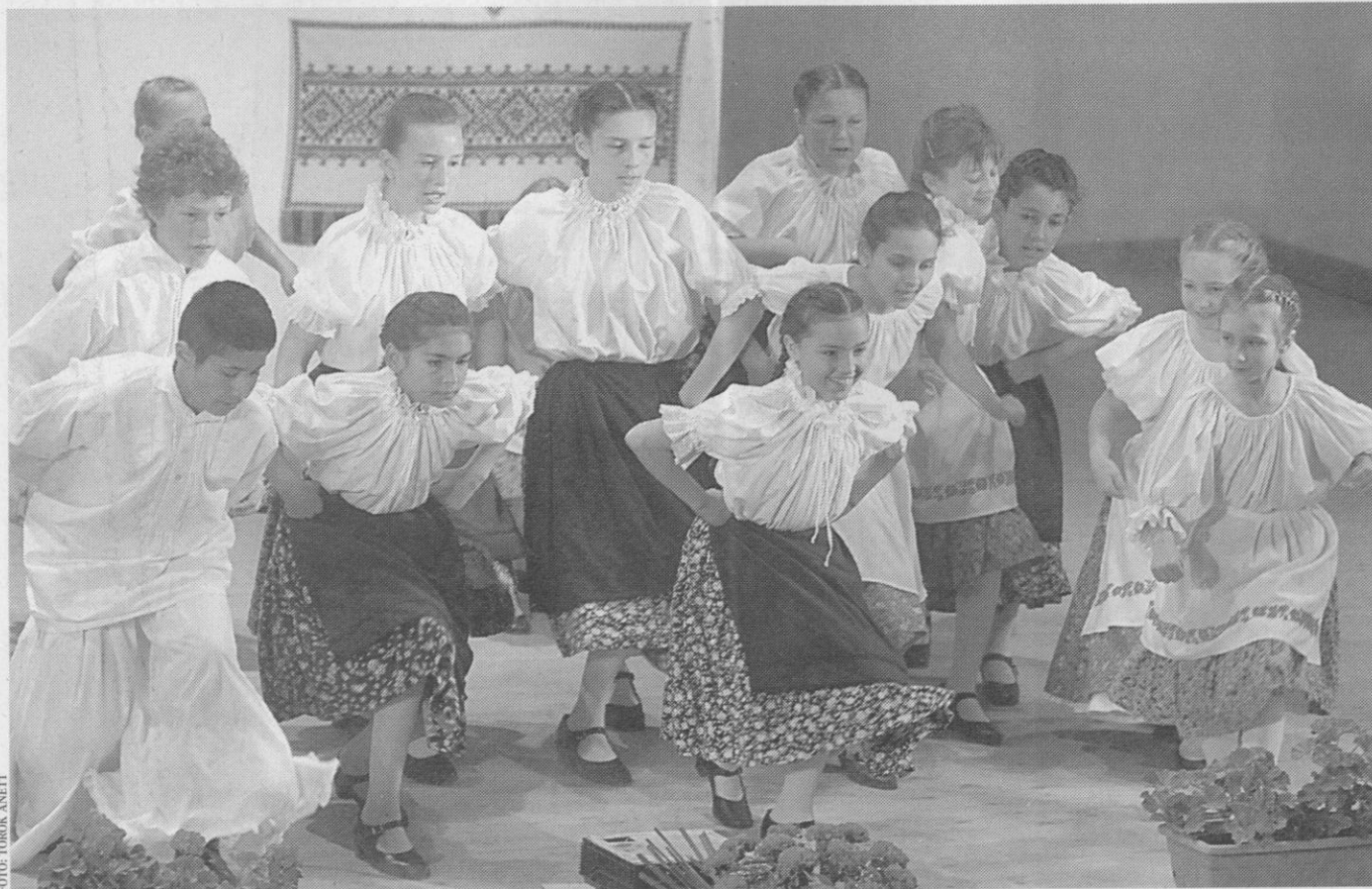
A fiatalokon múlik, hogy elfelejtődnek vagy tovább élnek hagyományaink. A művészeti iskolák, egyesületek működése lehet a jövő záloga

A magyar népiség iránti érdeklődés nálunk is már a XVIII. század vége felé megkezdődött, de egyelőre inkább csak politikai-társadalmi, illetve nyelvi, irodalmi szempontból, valamint a ruházódás terén. Megindult a magyar népköltés alkotásainak gyűjtése, tanulmányozása, és műirodalmunk is mind gyakrabban merítette tárgyát a nép köréből, a népi életből. E népies irodalom azonban sokszor hazug romantikával teljesen ferde képet ad a magyar népről, annak életéről. A szabadságharc leverése után az elnyomás ellenhatásaként csak fokozódott a népies irányzat irodalomban, viseletben, táncban, dalban egyaránt. A tárgyi néprajz terén a rendszeres vizsgálódások a múlt század vége felé kezdődnek, amikor 1889-ben megalakul a Magyarországi Néprajzi Társaság. Akkor már érezni lehetett, hogy letűnik egy kor. Társadalmi, gazdasági átrendeződés elején voltunk, elindult egy más folyamat. Ipari forradalom, ahol a gyári termékek előtérbe kerültek a kézműiparral szemben. A hosszú évszázadok alatt megőrzött darabokat menteni kellett. Voltak családok, ahol a dédszülők, nagyszülők tárgyait, tárgyezüstjeit megőrizték. Ezek közül került nagyon sok a múzeumba. A So-