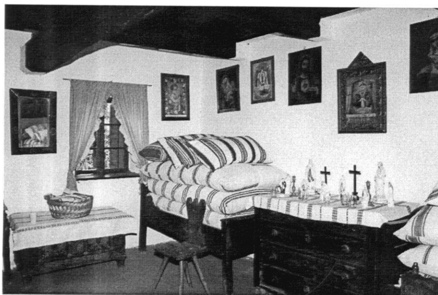
Buzsáki tájház (szobarészlet)

A hímzés ma is hozzátartozik az asszonyok mindennapjaihoz. Rendszeresen tartanak a tájház udvarán bemutatókat, ahol vásárolni is lehet termékeikből.