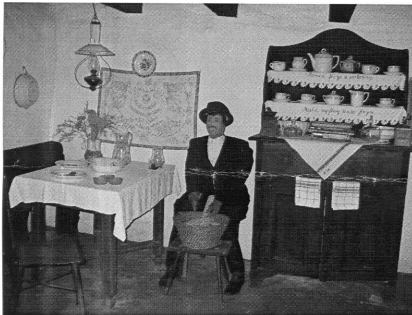
A vörsi tájház konyhája (részlet)

A lakóház utolsó tulajdonosa 1971-ben költözött ki, majd az Országos Természet- és Környezetvédelmi Hivatal gondoskodott a műemléki helyreállításáról. 1978-ban a falu adományaiból rendezték be a tisztaszobát, a konyhát és a kamrát. A hátsó szobában a Kisbalaton élővilágát bemutató kiállítás látható. A pajtában jelenleg nincs kiállítás, a fenntartó terve, hogy gyermekfoglalkoztatóvá alakítja.