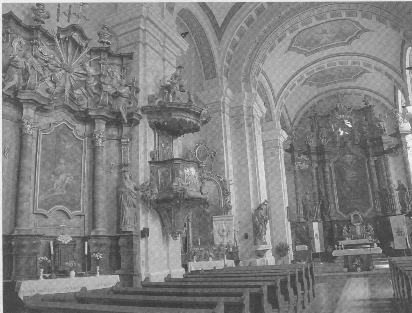
A patinás templom nem csak kívülről szép. Két oltárkép is díszíti belülről. Az egyik 1777-ben, a másik 1779-ben készült