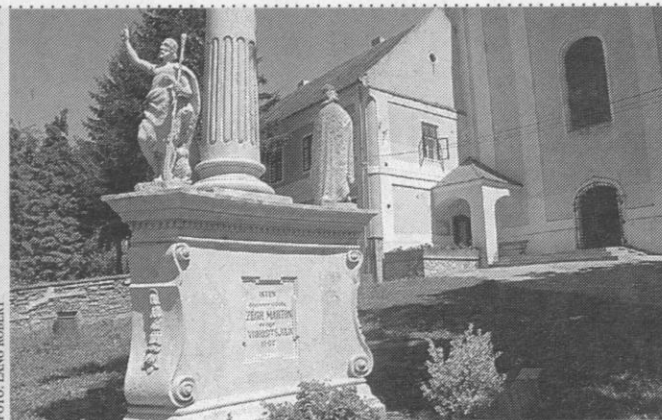
A ferences kolostor másik nevezetessége az udvaron álló emlékmű

A FERENCESEK ELLEN 1950 második felében indult országos méretű támadás a helyi közösséget is érintette. Július 10-én éjjel felszámolták és kitelepítettek több ferences rendházat és a szerzeteseket, köztük a segesdi rendház tagjait is.