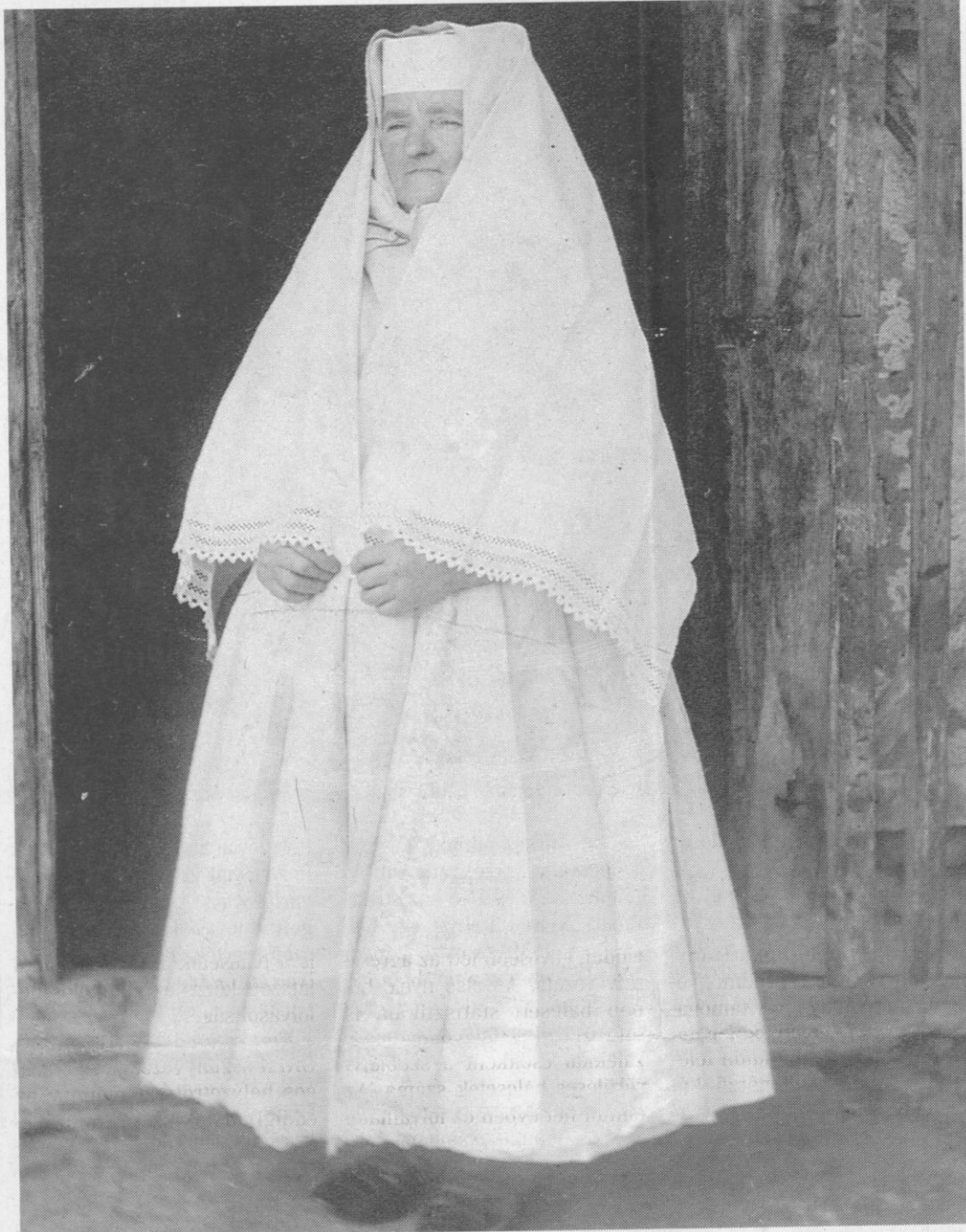
A fehér gyász a zselici reformátusok és a drávai horvátok körében is megérte a 20. századot

„Nem megyek, nem megyek idegen országba,