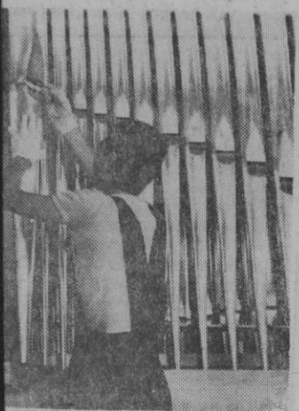
Romezersípos óriás orgona Kézműves Vállalat aquincumi 37 regiszteres orgona az nyár végén.

Elment? Itt él műveiben, a táncosok minden kecses és kemény mozdulatában, a falusi aranyzajú asszonyok pávakőri dalolásában, most és mindörökké.