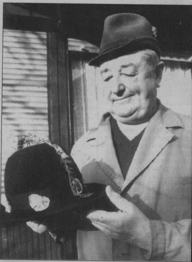
Nyolcszáz éves fazon: a karádi kanászkalap

Nem terem manapság minden bokorban kalapos. Kovács Ferenc kaposvári mester nem is tud más szakmabeliről a közelben, az egész Dunántúlról hozzá jár, aki javítat, mosat vagy új kalapot készítet.