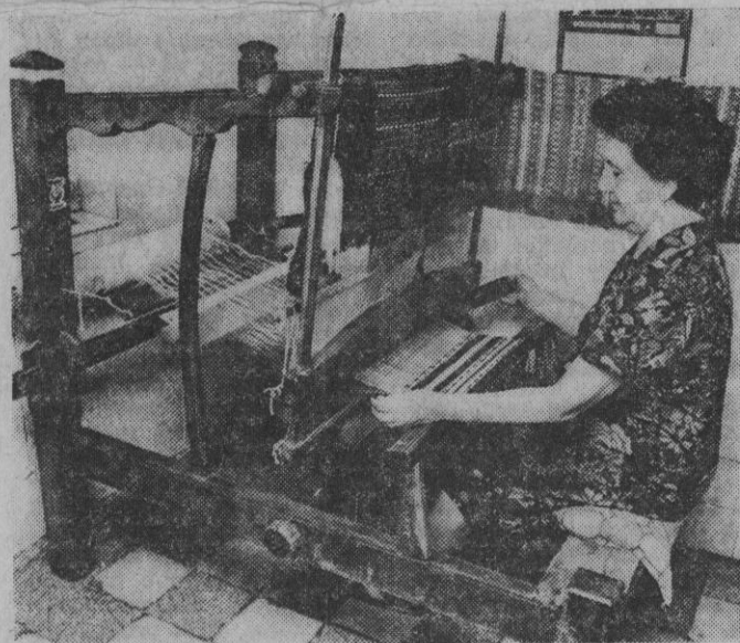
A szövészéket ma is használják

— Sok mindent elvittek a faluból. Nincs olyan hónap,