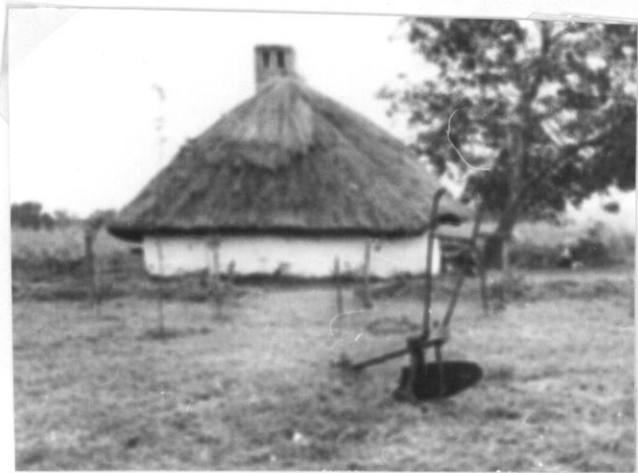
A telekhatárt itt a turatójeke jelzi.