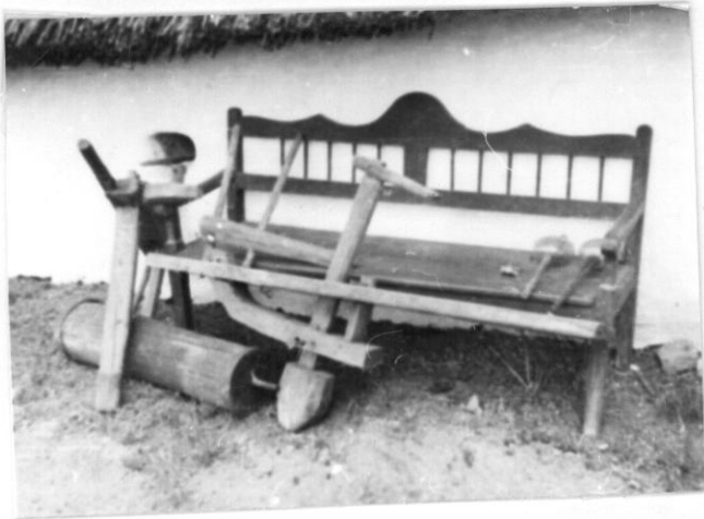
A ház falának támasztott az ülőpad, a fahenger és a fából készült turató.