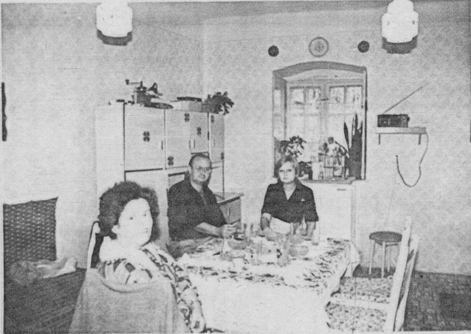
A konyha képe

Innen nyílik a spaiz, mely szintén tágas, jól el lehet pakolni benne.