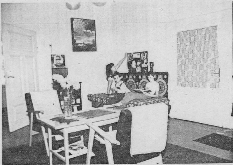
A szobám képekben