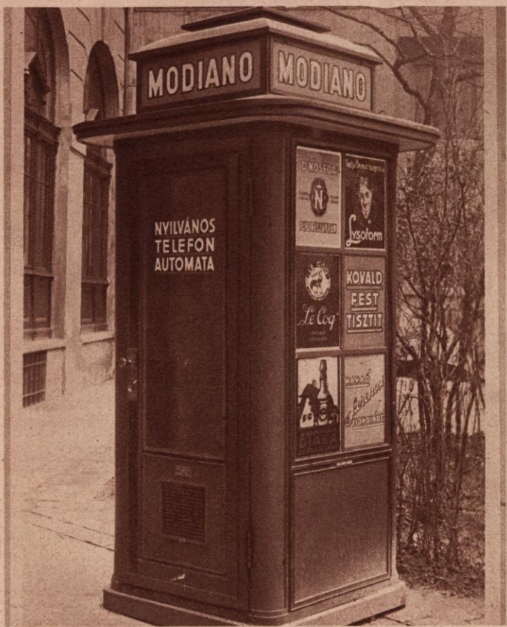
NYILVÁNOS TELEFÓNAUTOMATA, MELYET AZ ÁLTALÁNOS BESZERZÉSI ÉS SZÁLLÍTÁSI RÉSZVÉNYTÁRSASÁG ÁLLÍT FEL BUDAPEST UCCÁIN ÉS TEREIN. A szabadalmazott pavillont tervezte és készíti: HAAS ÉS SOMOGYI R. T.