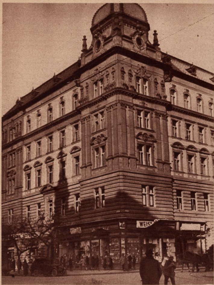
A NOVA KÖZLEKEDÉSI ÉS IPARI R.-T. SZÉKHÁZA