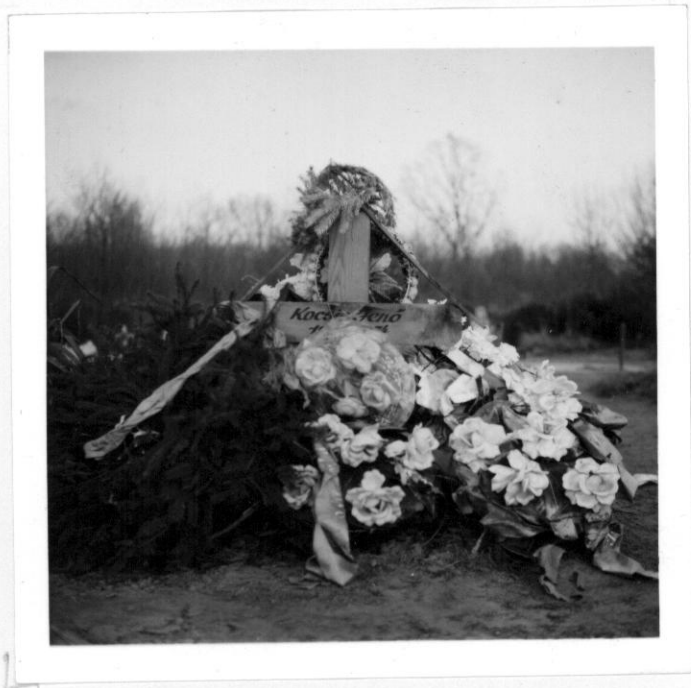
Jenő bácsi sirja a kadarkuti temetőben