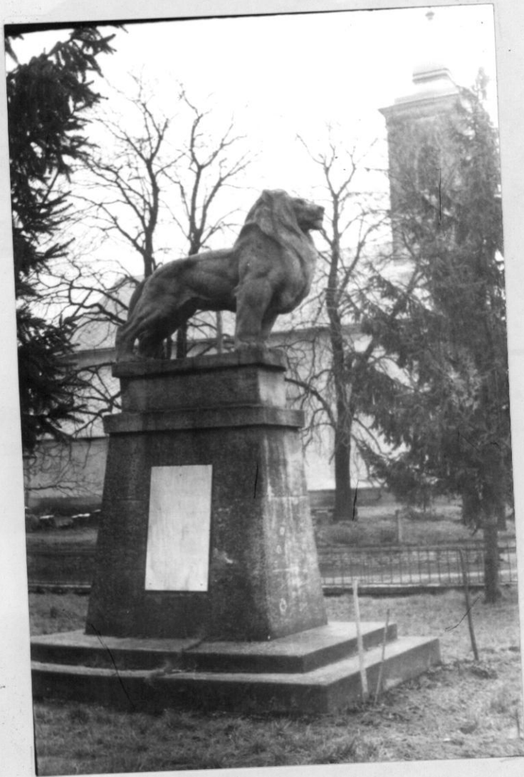
Az első világháború kadarkuti halottainak emlékére állított hősi emlékmű a Főtéren