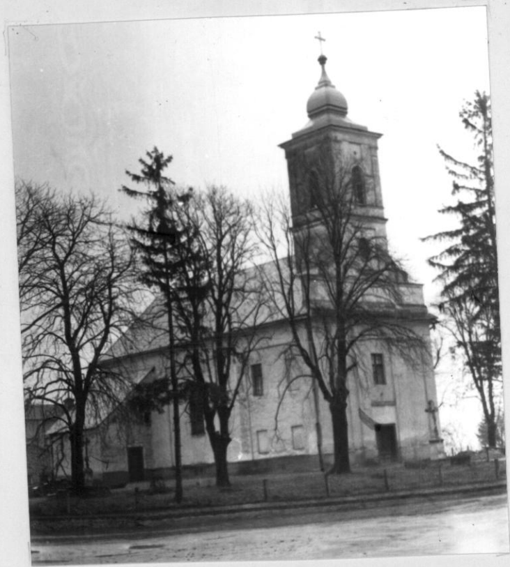
A község XVIII század elején épült műemlék-jellegű temploma