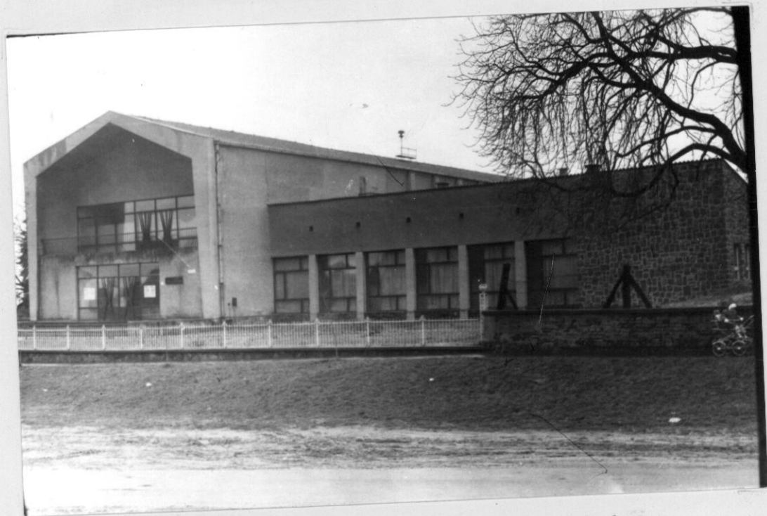
Művelődési ház. Épült az ötvenes évek végén.