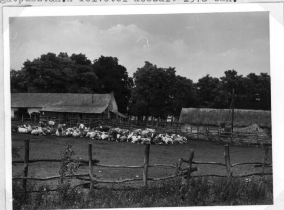
Somogy megye Inampuszta téesz szállománya állománya a nyári karánban. A fénykép felvétel készült 1978 ban.