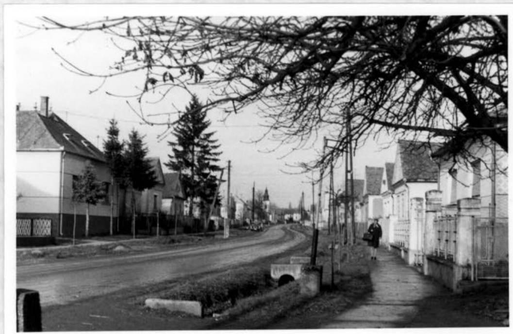
Porrogszentkirály Fő utca részletei