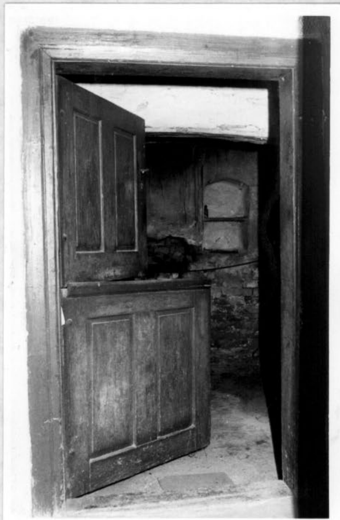
Porrogszentkirály utolsó füstös- konyhája