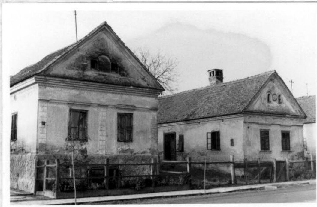
A tűzvész után épült házak. A homlokzaton 1899-es évszámmal