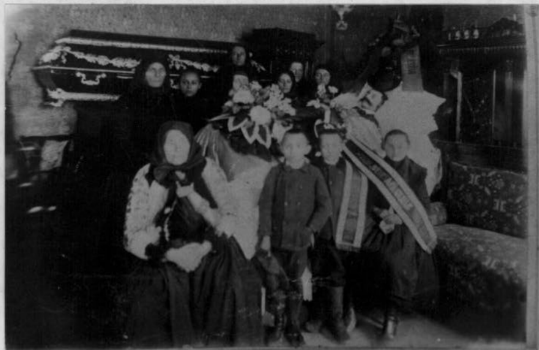
Kihalottozás. /A téli öltözet is jól látható. - Kisbunda, csizma, bájkó./