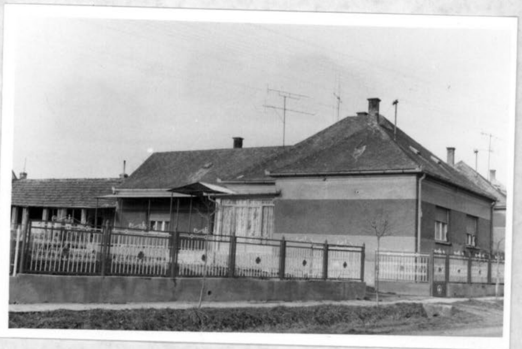
és a jelen ház-típusai