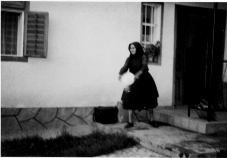
Az öntöt vízzel megmosdatták a gyermeket, utána 4 naplemente irányába kellett kiönteni a vizet.