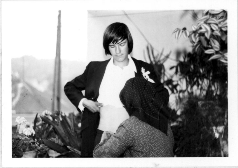
Nyálasfónál felkötése vőlegényénél.