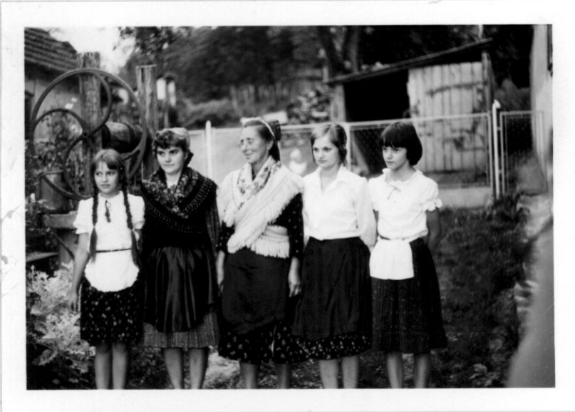
Lányok, menyecskék népviseletben.