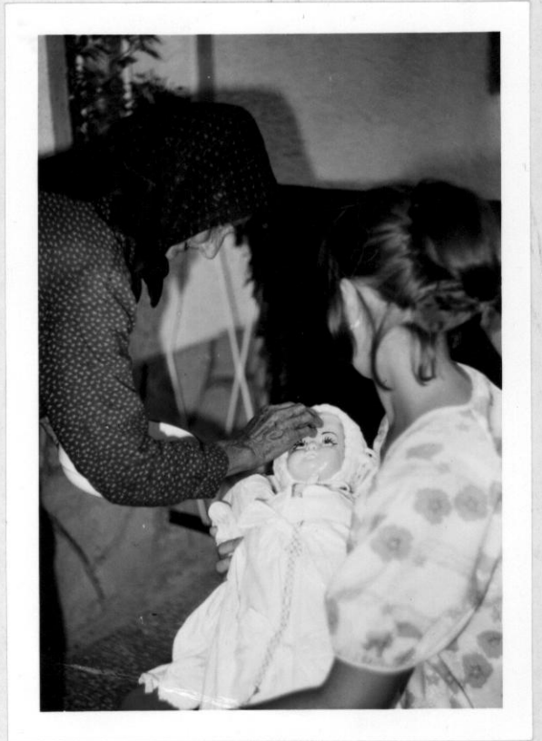
Az öntöttvízből a nevetlen ujjukkal a gyermekek szájába csöpögtettk.