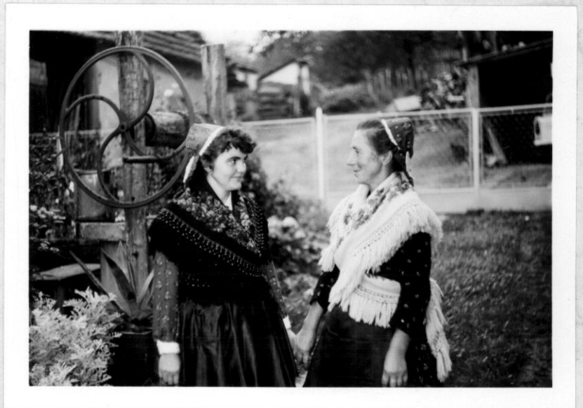
Pogányszentpéteri menyescék népviseletben.