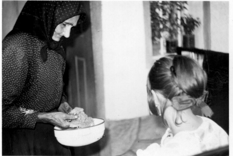
A hidegvízbe összeállt viaszt, jellel kihozta a gyermek betegségét.