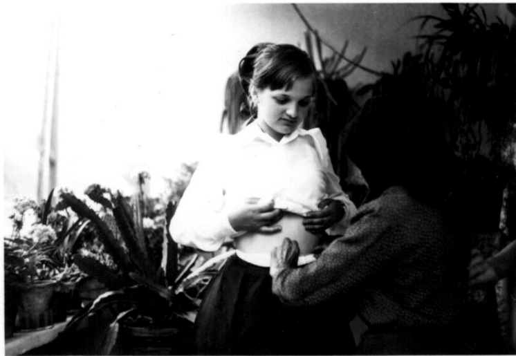
Kántorcérnát kötöttek a leány derekára, ha annak valamelyik legény megtettse tt és el akarta magát vetetni feleségül.