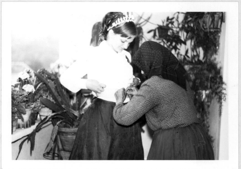
Kántorcérnának a legény- fogás esetén nevezték a nyá- lasfonalat.

Nyálas fonalat kötöttek a menyasszony derekára az esküvőre való indulás előtt az igéző szemek ellen.