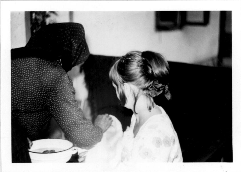
* Ha a gyermek beteg volt, elvitték az öntőasszonyhoz és megöntették.