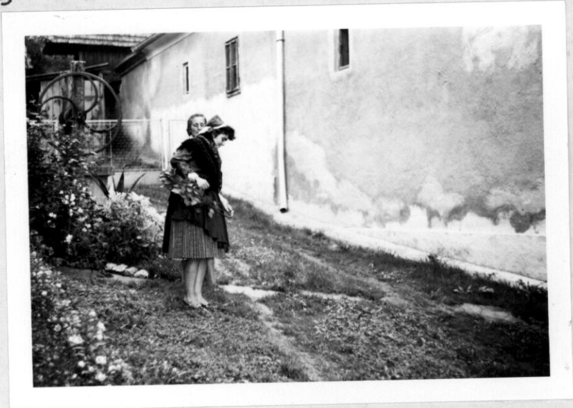
Nyirfakarikány való utbujás, hogy boszorkányokká tudjanak válni nyirfá- ból készített karikán kellett átbujni. /Nyirágból készül/